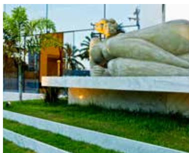
EDIFÍCIO MADISON / BRUNO LIMA

acabou transformando a Ilha do Leite em um polo empresarial. Ergueu um complexo de seis torres comerciais - uma delas, o Charles Darwin recém-entregue aos condôminos.