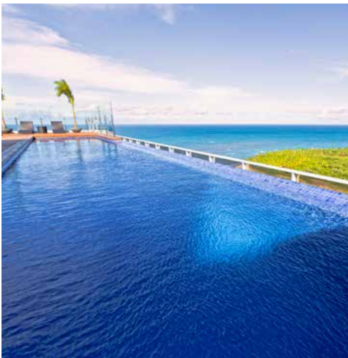
PISCINA TRYP

No segmento hoteleiro, a Rio Ave trouxe bandeiras internacionais para o Nordeste: o Ramada Hotel e Suítes Recife, primeiro da rede na região, localizado em Boa Viagem. Já em parceria com o grupo espanhol Meliá Hotels International, a construtora ergueu o TRYP Pernambuco, também primeiro da bandeira no Nordeste, na beira-mar da Nova Barra, em Jaboatão dos Guararapes. Ambos possuem também a opção de morar e até mesmo investir em quartos, no formato pool. A Rio Ave também atraiu o primeiro hotel da rede americana Marriott International no Nordeste e primeiro Courtyard by Marriott do país, também em Boa Viagem.