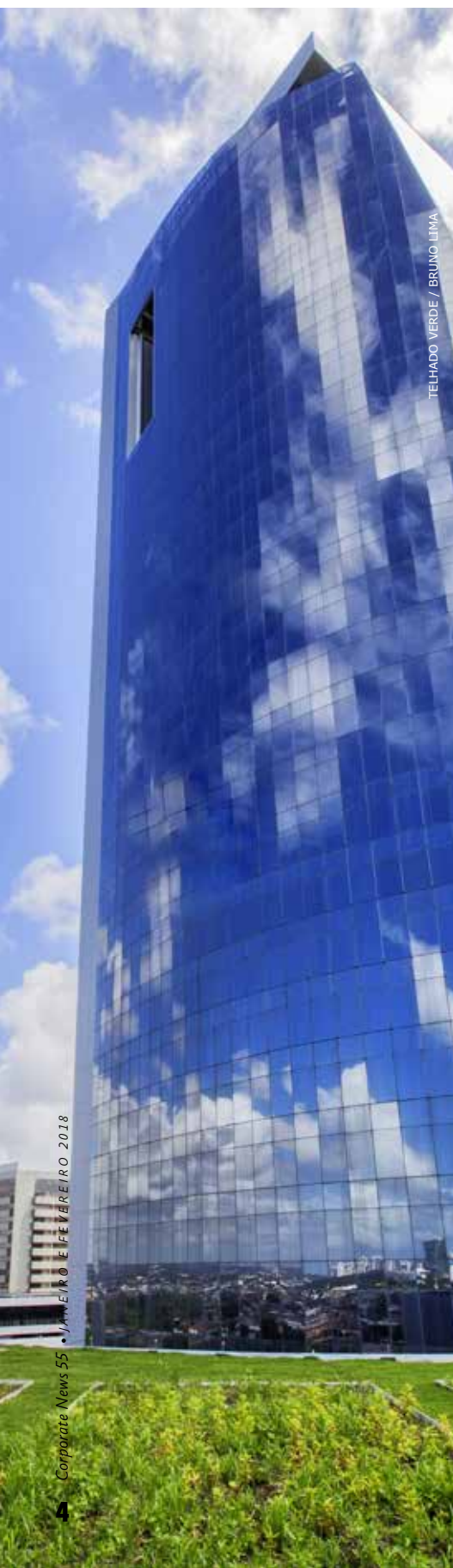
TELHADO VERDE / BRUNO LIMA